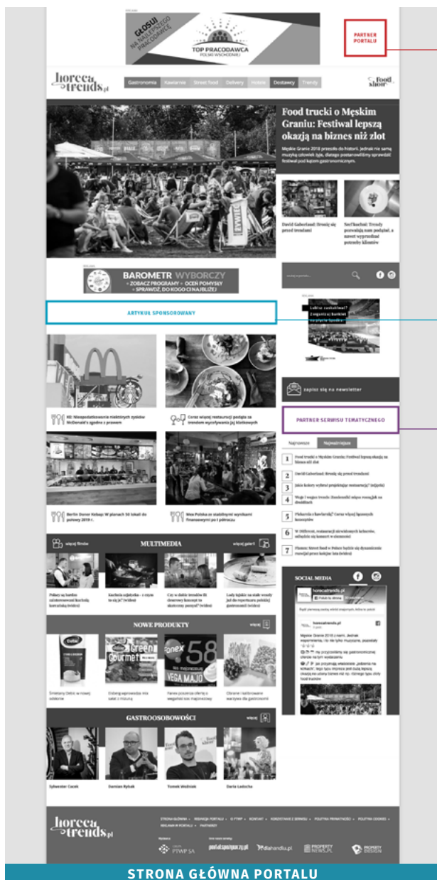
STRONA GŁÓWNA PORTALU