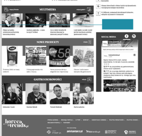
STRONA GŁÓWNA PORTALU

W celu zasięgnięcia dodatkowych informacji prosimy o kontakt z Biurem Reklamy Grupa PTWP Plac Sławika i Antalla 1, 40-163 Katowice Dział Marketingu i Sprzedaży marketing@ptwp.pl tel.: 32/ 356 76 58