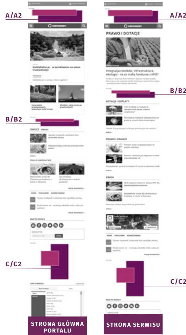
STRONA GŁÓWNA PORTALU