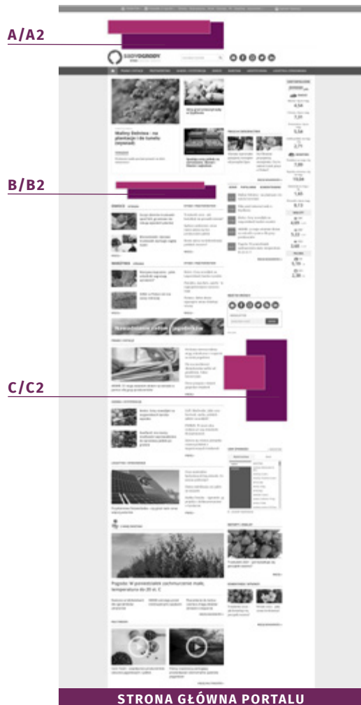
STRONA GŁÓWNA PORTALU